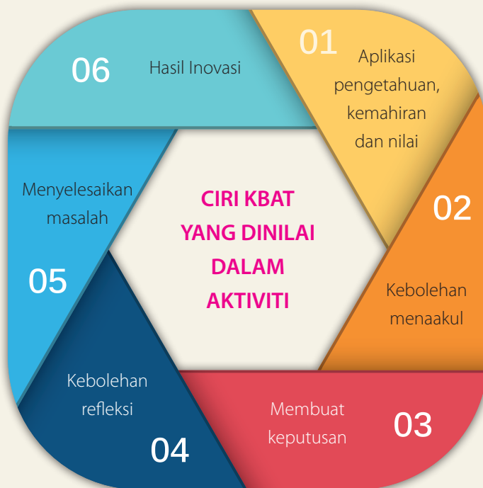
Rajah 4: Ciri KBAT dalam Penilaian Kokurikulum

Penilaian aktiviti kokurikulum dilakukan secara berterusan sepanjang tahun bagi menilai pencapaian dan kebolehan murid dalam menyiapkan sesuatu aktiviti. Setiap proses kerja dan hasil kerja akan diberi penilaian dan akhirnya menyumbang markah keseluruhan kokurikulum. Penilaian dibuat berdasarkan ciri KBAT dalam Rajah 4.