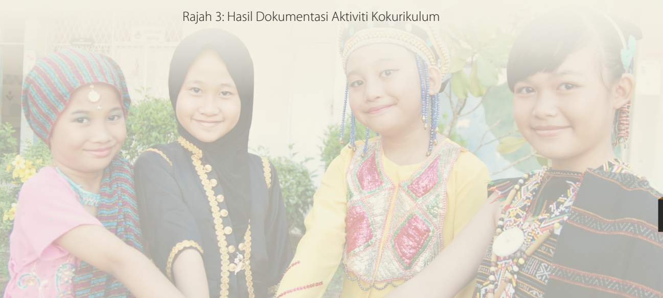
Rajah 3: Hasil Dokumentasi Aktiviti Kokurikulum